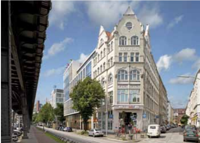
Schöne Verbindung: Das geplante Gebäude Vorsetzen 54 schließt harmonisch an die historische Fassade des denkmalgeschützten Gebäudes Vorsetzen 53 an.